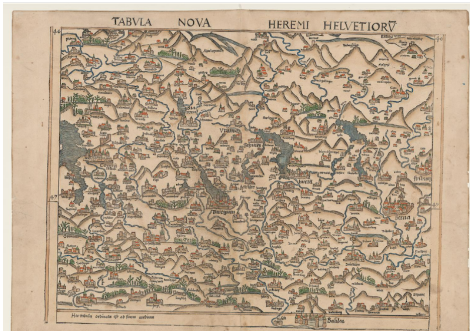
Gasser Abb 2

Eine gewisse Verbreitung fand auch Türsts kartografische Pionierleistung: sein Werk diente als Vorlage für die «Tabula Nova Heremi Helvetiorum», die Martin Waldseemüller in seinem 1513 in Strassburg gedruckten Weltatlas veröffentlichte. 3 (Abb. 2)