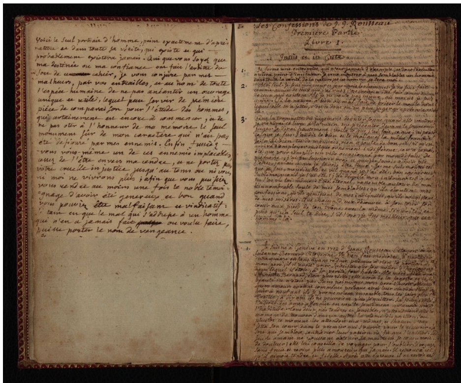
BGE Confessions Rousseau ms fr 00227 1 p000verso 001entier

Mentionnons enfin les dossiers du Programme d'éradication de la variole (1948-1987), en 2017, une soumission de l'Organisation mondiale de la Santé qui prend une résonance particulière ces années-ci.