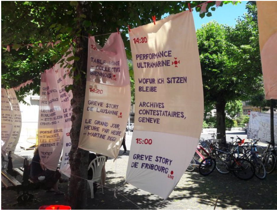
2022 06 14 Greve Feministe Bienne 6

Les archivistes de la société Clio Archives accompagnent également des associations et communautés d'«en bas» qui ne souhaitent pas être institutionnalisées: elles traitent leurs fonds d'archives et rendent ces communautés autonomes dans la gestion de leur propre passé.