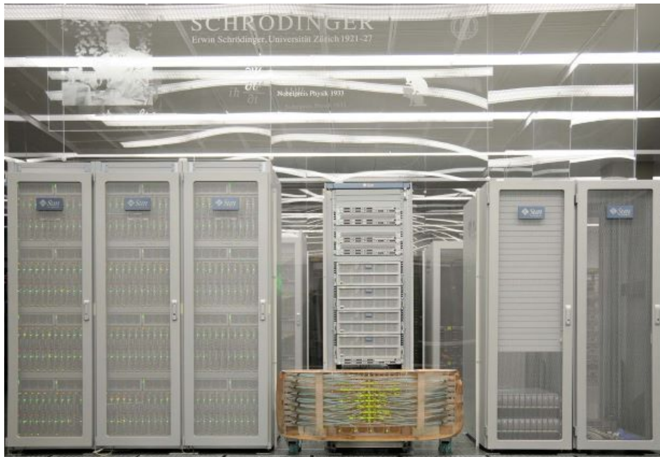
UAZ E 17 1 368 Grossrechner Schroedinger 2009

Universitätsarchive müssen mit dem wissenschaftlichen Fortschritt an den Hochschulen Schritt halten. Da Universitäten zu den ersten Institutionen gehörten, an denen Computer benutzt und Rechenzentren installiert wurden, an denen die ersten Emails verschickt wurden und den analogen Schriftverkehr ablösten, etc. gehörten Universitätsarchive auch zu den ersten Archiven in der Schweiz, die die Digitale Langzeitarchivierung erfolgreich einführten. In diesem Bereich gehörten das Universitätsarchiv Zürich sowie das ETH-Hochschularchiv Zürich zu den Vorreitern. Das Universitätsarchiv Zürich war zudem das erste Hochschularchiv, das Unterlagen aus einem GEVER-System archivierte.