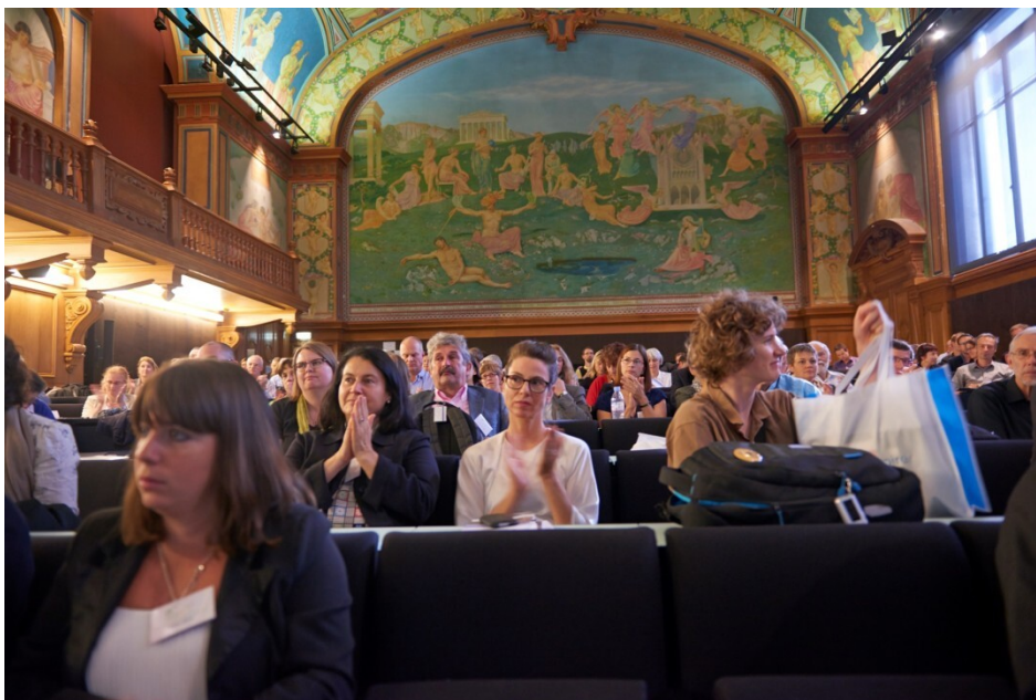
Assemblée générale à Lausanne en 2014

La République et Canton du Jura, le dernier-né des états membres de la Confédération (1978) a été l'ultime canton à accueillir une assemblée générale, encore au XX e siècle, en 2000. Il faudra attendre 1998 pour que le chef-lieu du canton du Tessin, Bellinzone soit le lieu de l'Assemblée générale, à la place de Lugano qui l'avait reçue en septembre 1924 et septembre 1976. Depuis, l'AAS a tenu une nouvelle assemblée à Porrentruy, en 2015, et à Bellinzone, en 2022.