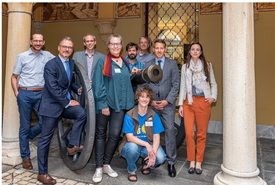
Le Comité de l'AAS lors de l'Assemblée générale à Bellinzona en 2021