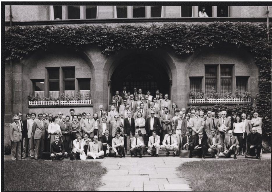
60. Jahresversammlung des VSA 15./16. September 1983 in Basel