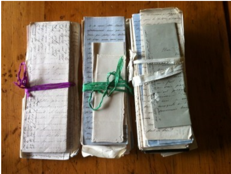
Liasses de lettres

Les documents privés donnés ou déposés aux AVO sont de nature très diverse : correspondances familiales et amoureuses, journaux intimes et livres de raison, carnets de voyage, comptes de ménage, agendas, almanachs, anciens bulletins scolaires et titres obtenus, livrets de famille et autres pièces officielles. Beaucoup de fonds arrivent déjà triés par les déposants, d'autres non ; ils contiennent parfois des photographies, des cartes postales non écrites, des objets (tableaux, portefeuilles) dont la place serait plutôt dans un musée. Dans tous les cas, les AVO s'efforcent de conserver les fonds dans leur intégralité et dans l'ordonnance voulue par le donateur.