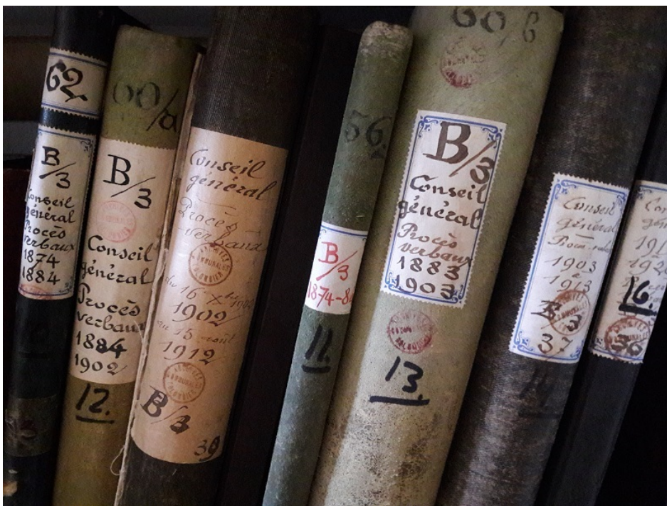
Archivage SI Ar 852 2016 06 Depot archives Colombier

Dans certains cantons, les fusions de communes sont de plus en plus fréquentes, et ce généralement pour rationaliser les ressources communales. C'est parfois une opportunité pour traiter les fonds d'archives des anciennes communes avant la fusion et pour mettre en place un système de gestion documentaire cohérent pour l'ensemble de la nouvelle administration communale, mais lors de telles réorganisations, les archives sont généralement dans les dernières priorités. Par ailleurs, elles encourent le risque que les fonds d'archives des anciennes communes restent dans les anciennes maisons communales sans surveillance et petit à petit oubliés, voire disloqués ou détruits lors d'une nouvelle affectation du bâtiment.