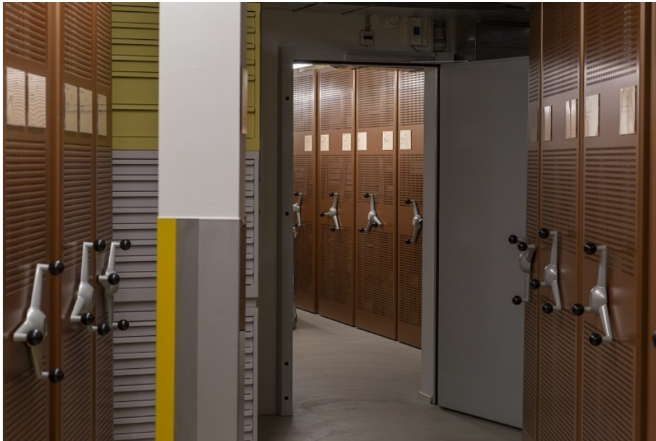
Stadtarchiv MG 9797

Plusieurs des villes qui disposent de leur propre service d'archives participent au groupe de travail "Archives communales" de l'AAS. Parmi elles les villes de Zurich et de Lucerne.