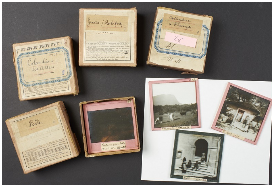
Archivage SI Ar 852 2020 Plaques verre

Enfin, les archives communales conservent souvent des collections photographiques ou iconographiques, témoignages de l'histoire locale, et des fonds privés d'associations, de partis politiques ou de personnalités locales viennent parfois enrichir le patrimoine archivistique communal.