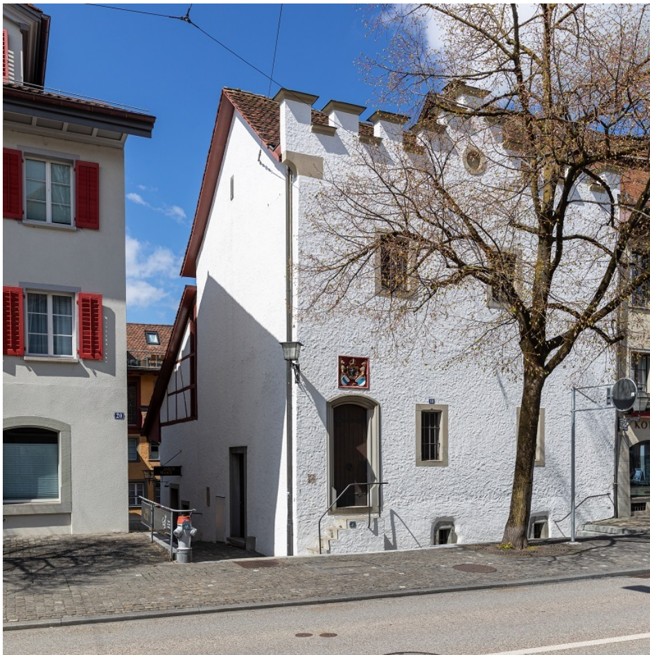
Anken Waage Burgerarchiv Zug

Dans certains anciens villes-cantons comme Genève ou Lucerne, les archives de ces anciennes bourgeoisies forment la base des archives cantonales correspondantes. À l'avènement des communes municipales ou politiques actuelles au 19e siècle, certains fonds de bourgeoisies ou de corporations ont été déposés dans les archives communales où ils forment parfois la base de ces archives.