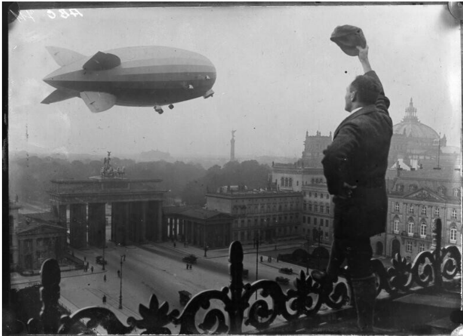
Sander Abb 2

Es finden sich aber auch Retuschen aus militärischen Gründen in den Bildbeständen des Bundesarchivs: Auf einer Bilderserie des Films «Bild 1011-718-0149», die eine Besprechung zwischen den Generalen Gerd von Rundstedt und Erwin Rommel zeigt, wurde die auf dem Besprechungstisch liegende Karte unkenntlich gemacht. Dabei fand die Manipulation bereits auf dem Negativ statt, was bei den im Bundesarchiv vorhandenen Bildern eher selten festzustellen ist – deutlich in der Überzahl sind Bearbeitungen bei (veröffentlichten) Abzügen.