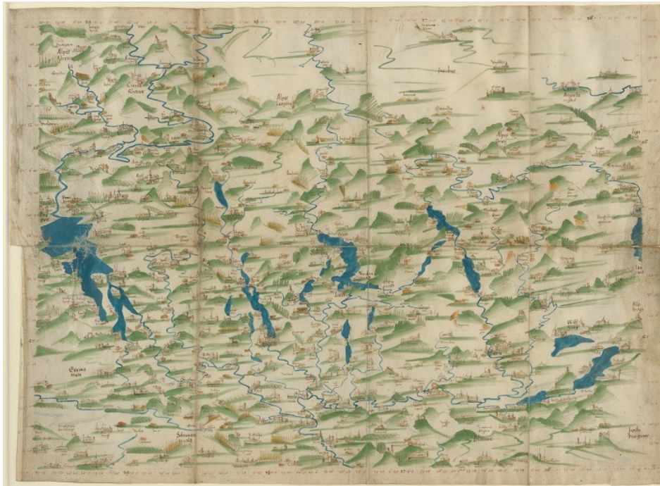
Abb. 1: Konrad Türist, [De situ confoederatorum descriptio], 1495/97, Tusche und Aquarell auf Pergament, 39 x 53 cm Public Domain: Zentralbibliothek Zürich, Signatur: Ms Z XI 307a, https://doi.org/10.7891/e-manuscripta-17854

War über Jahrhunderte hinweg Papier das am häufigsten verwendete Kartenmaterial, wird heute die überwiegende Anzahl der Karten vollständig computergestützt hergestellt und genutzt. Die Kartenelemente werden als Vektordaten gespeichert und mit Attributen verknüpft. An dieser Stelle sei nur auf die digitalen Karten der swisstopo und die in diesem Jahr von der Schweizerischen Gesellschaft für Kartografie ausgezeichnete swisstopo-App verwiesen.