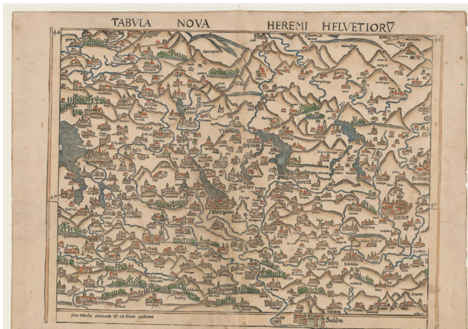
Abb. 2: Tabula Nova Heremi Helvetiorum, Holzschnitt, aquarelliert, 41 x 52 cm, hg. von, Martin Waldseemüller, [Strassburg]: [Schott], [1513]

Eine gewisse Verbreitung fand auch Türsts kartografische Pionierleistung: sein Werk diente als Vorlage für die «Tabula Nova Heremi Helvetiorum», die Martin Waldseemüller in seinem 1513 in Strassburg gedruckten Weltatlas veröffentlichte. ( Abb. 2 )