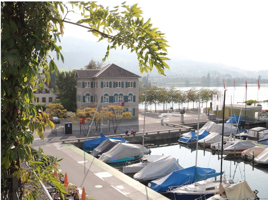
Idyllisch am See gelegen: Blick auf den Nachfolgebau an der Geburtsstätte Joachim Raffs. Im untersten Stock ist das Joachim-Raff-Archiv beheimatet.