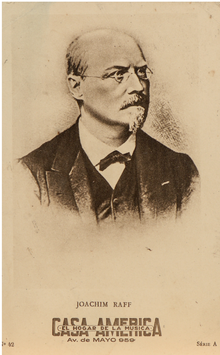
Sammelkarte der Reihe «Galeria de los grandes Maestros» mit einem Bildnis von Joachim Raff (Mondel & Jacob, wohl 1870er-Jahre), Buenos Aires, Beginn des 20. Jahrhunderts.