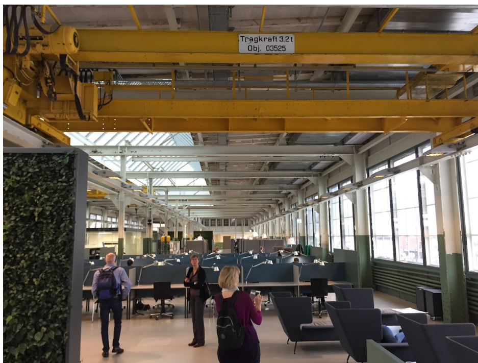
Früher «Stiftehimmel», heute Lernlandschaft. Nicht geändert hat sich das Ziel: Bildung.

An der ZHAW herrscht eine Philosophie der offenen Räume, erklärt Rutishauser. Das gilt auch für Hörsäle. Die zehn Vorlesungsräume im ersten Obergeschoss sind Verbindungsglied und Erweiterung von Bibliothek darunter und Lernlandschaft darüber. In diesem intermediären Geschoss finden Ruhesuchende zudem einen Raum der Stille. Schlicht, in gedeckten Farbtönen gehalten, ist dieser überkonfessionelle Ort der Einkehr eine Insel der Ruhe. Laut ist es an diesem Oktobersamstag nicht – schaffig aber sehr wohl. Obwohl das Semester noch nicht alt und die Prüfungssession noch weit weg ist, sind Bibliothek und Lernlandschaft sehr gut besucht. Während die Studierenden zwischen den Bücherregalen gleichsam verschwinden, ist im ehemaligen Lehrlings- und heutigen Lernhimmel die geistige Energie praktisch mit den Händen greifbar. Der Erfolg zeigt, dass solche Angebote genutzt und geschätzt werden. Moderne Bibliotheken bieten mehr als Medien. Die ZHAW-Bibliothek auf dem Winterthurer Sulzerareal zeigt, wie attraktiv das sein kann.