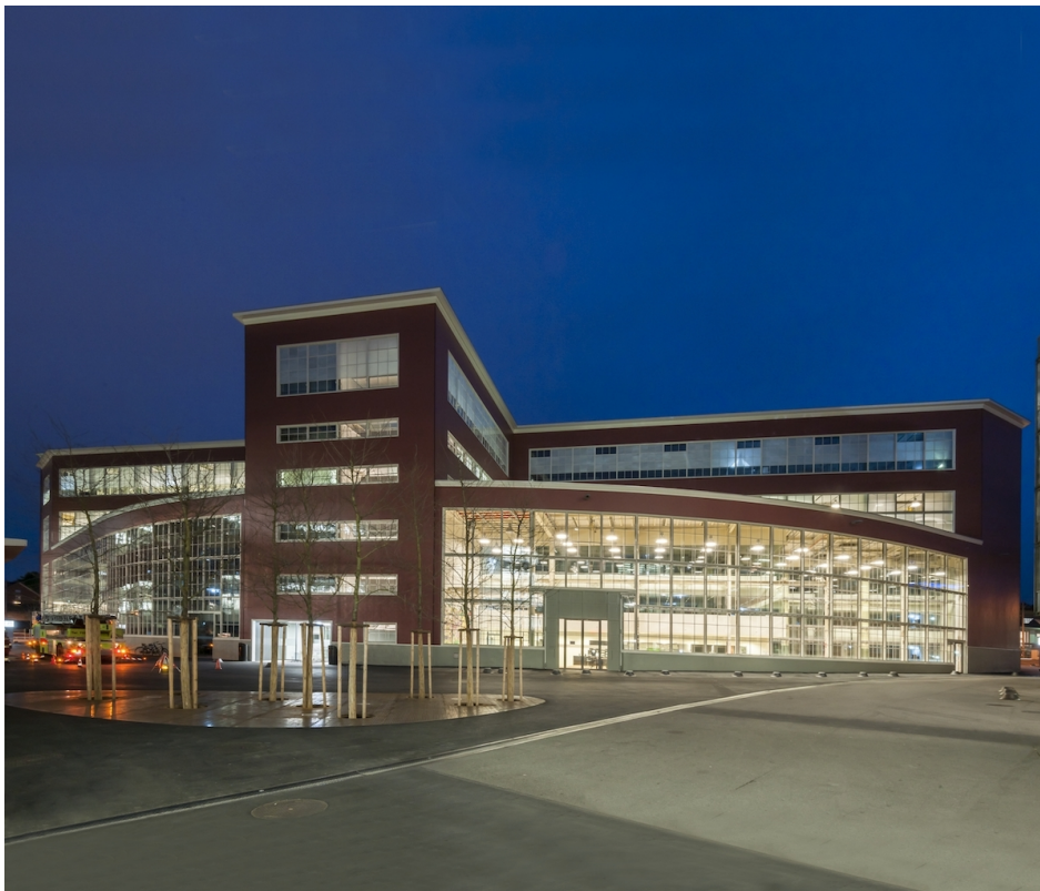
Die ZHAW-Bibliothek im Haus Tista Murk.

Unweit der heutigen Bibliothek, an klug gewählter Lage zwischen den Bahngleisen (der Bahnhof Winterthur war noch nicht gebaut) und der nach Zürich führenden Strasse, hatten die Gebrüder Sulzer 1834 die erste Bronzegiesserei erstellt. Sie läutete eine rund 150 Jahre dauernden Industriegeschichte ein. Lag das Gelände im 19. Jahrhundert am Stadtrand, befindet es sich heute mittendrin; 20 ha – etwa dieselbe Fläche wie die Winterthurer Altstadt –, wo in den 1960er-Jahren 14'000 Menschen arbeiteten. Doch die 1980er setzten Sulzer zu, der Konzern restrukturierte sich und gab Produktionsstandorte auf, 1988 das Gründungsgelände. Es wurde zum Entsorgungsproblem. Eine riesige Industriebrache mitten in der Stadt – die Stadtplaner waren gefordert. 1989 stellte Winterthur eine erste Projektstudie für den neuen Stadtteil vor. Wie so üblich in der Schweiz brauchte es mehrere Anläufe, Geduld und zahlreiche Kompromisse, doch heute gilt das Sulzerareal generell als vorbildlich für die Neunutzung eines Industrieareals, bei dem der alten Bausubstanz Rechnung getragen und der industriell geprägten Identität Respekt entgegengebracht wurde, ohne ins Museale zu verfallen. Da und dort präsentiert sich das Quartier zwar steril und still, doch gilt die Durchmischung der Nutzflächen von Arbeit, Freizeit, Einkaufen und Bildung als durchaus gelungen.