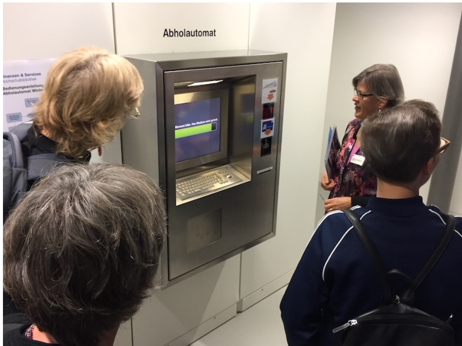
Dank dem Abholautomaten können bestellte Medien aus dem hauseigenen Bestand rund um die Uhr abgeholt werden.