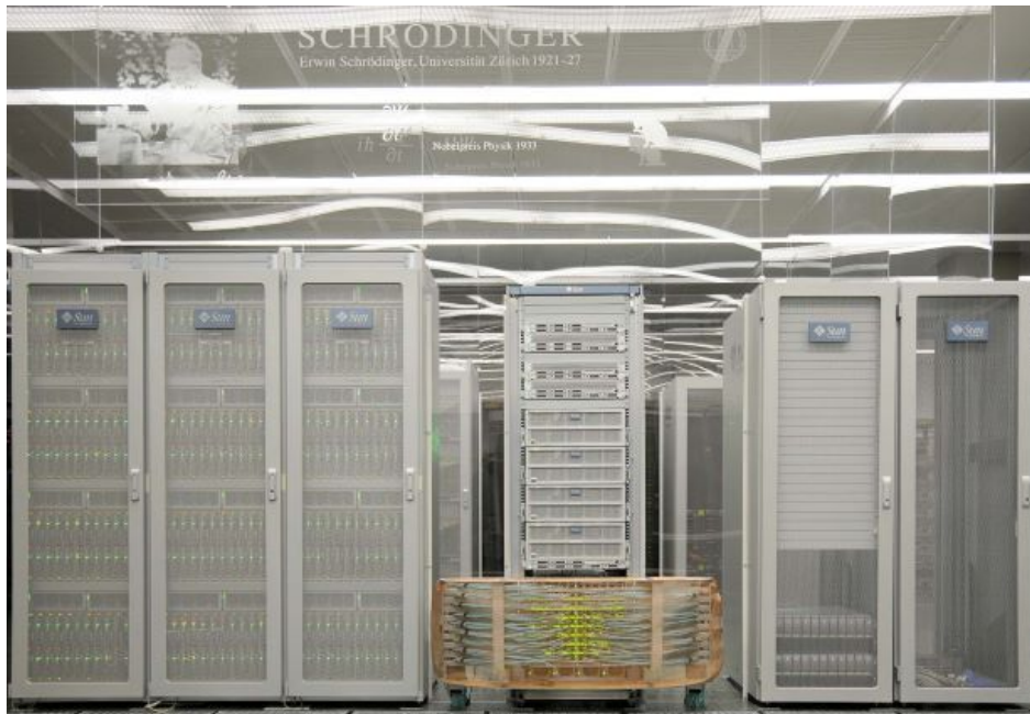
Der nach dem Nobelpreisträger Schrödinger benannte neue Grossrechner der Universität Zürich 2009

Universitätsarchive müssen mit dem wissenschaftlichen Fortschritt an den Hochschulen Schritt halten. Da Universitäten zu den ersten Institutionen gehörten, an denen Computer benutzt und Rechenzentren installiert wurden, an denen die ersten Emails verschickt wurden und den analogen Schriftverkehr ablösten, etc. gehörten Universitätsarchive auch zu den ersten Archiven in der Schweiz, die die Digitale Langzeitarchivierung erfolgreich einführten. In diesem Bereich gehörten das Universitätsarchiv Zürich sowie das ETH-Hochschularchiv Zürich zu den Vorreitern. Das Universitätsarchiv Zürich war zudem das erste Hochschularchiv, das Unterlagen aus einem GEVER-System archivierte.